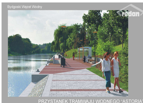
PRZYSTANEK TRAMWAJU WODNEGO „ASTORIA”

Celem projektu jest poprawa jakości zamieszkania poprzez kształtowanie interesujących przestrzeni publicznych związanych z Bydgoskim Węzłem Wodnym dla celów rekreacyjno-wypoczynkowych.