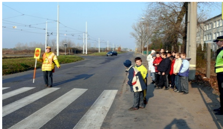
Akcja „Bezpieczna droga do szkoły”