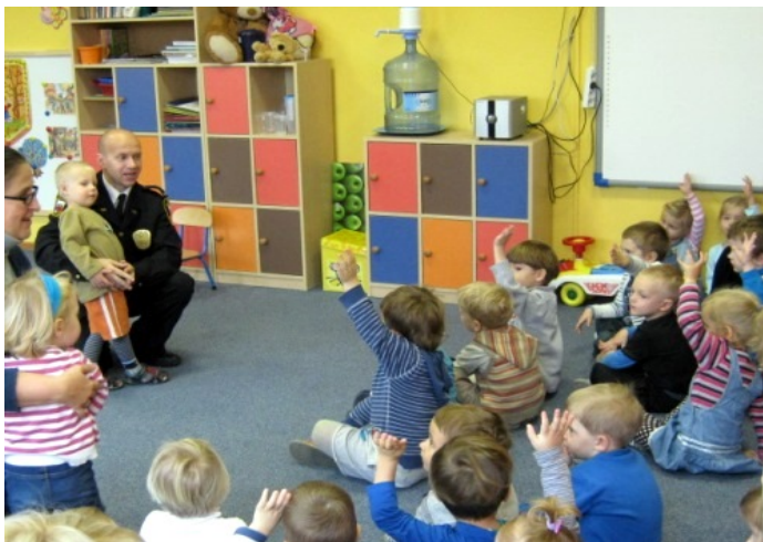
Akcja „Misiolandia”