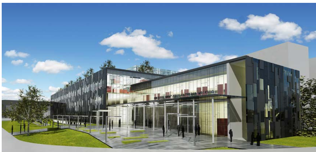
Wizualizacja Biblioteki UKW