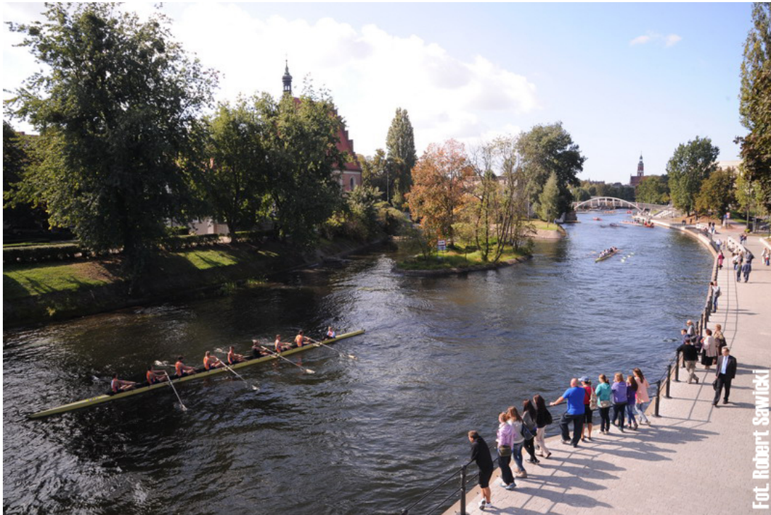
Rzeka Brda