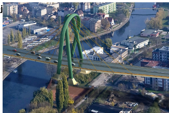
Wizualizacja trasy Uniwersyteckiej