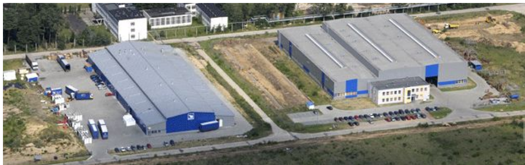
Bydgoski Park Przemysłowo-Technologiczny