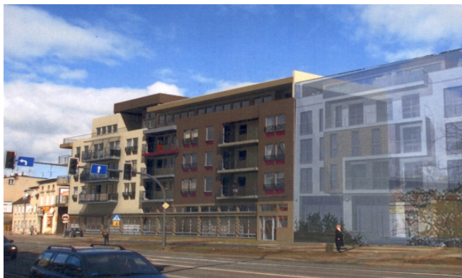
Wizualizacja budownictwa mieszkaniowego BTBS przy ul. Grunwaldzkiej 64, 66