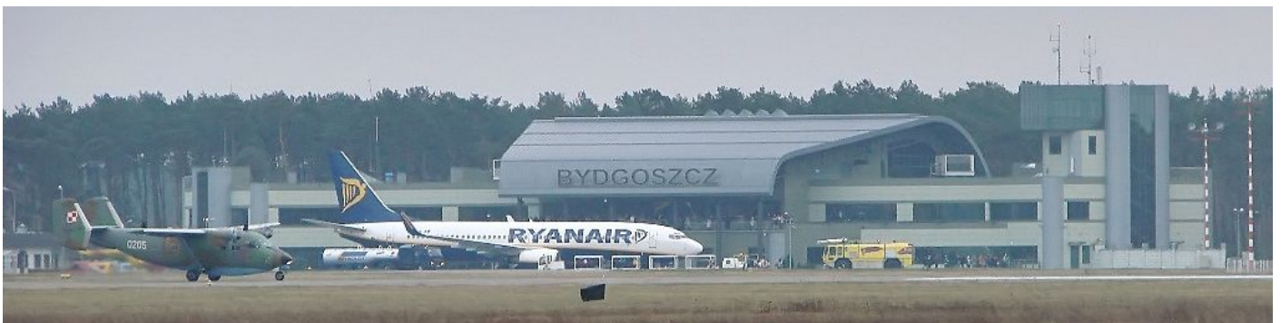
Port Lotniczy Bydgoszcz