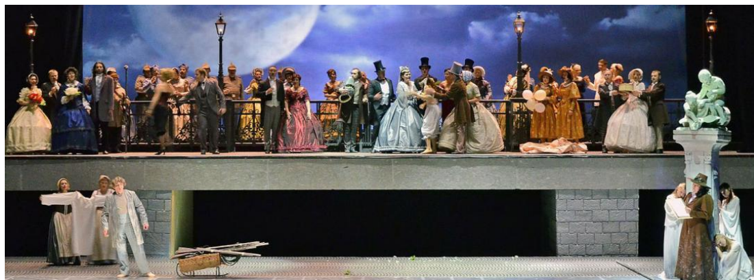
Scena Opery Nowa – opera „Rusalka”