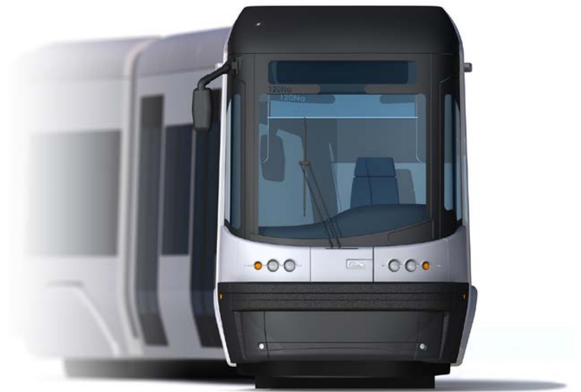
Wizualizacja tramwaju nowej generacji 120Na typu SWING