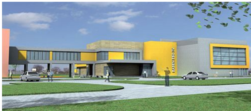
Wizualizacja krytego basenu na Błoniu przy Zespole Szkół Ogólnokształcących Nr 4