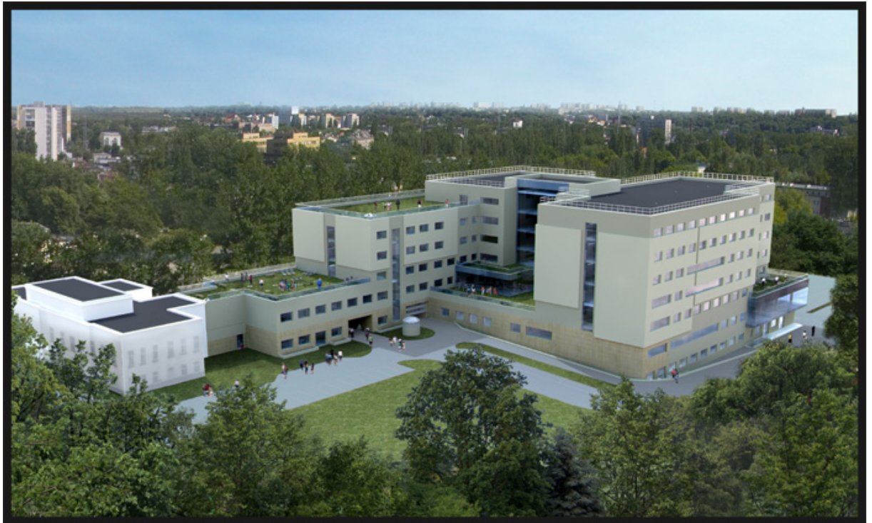
Wizualizacja nowego Wojewódzkiego Szpitala Dziecięcego