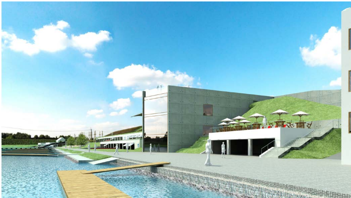
Wizualizacja przebudowy Toru Regatowego w Brdyujściu