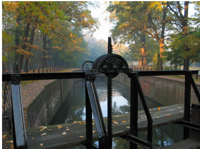
Śluza na Kanale Bydgoskim