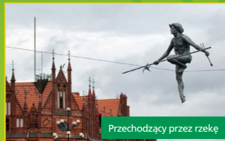
Przechodzący przez rzekę