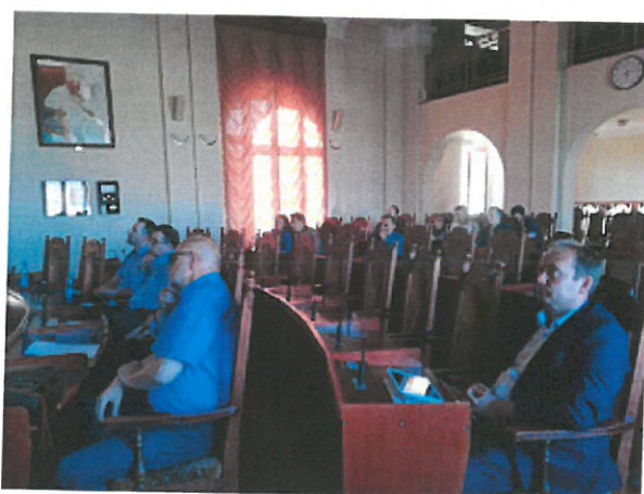
Fot. 1-2 Spotkania konsultacyjne